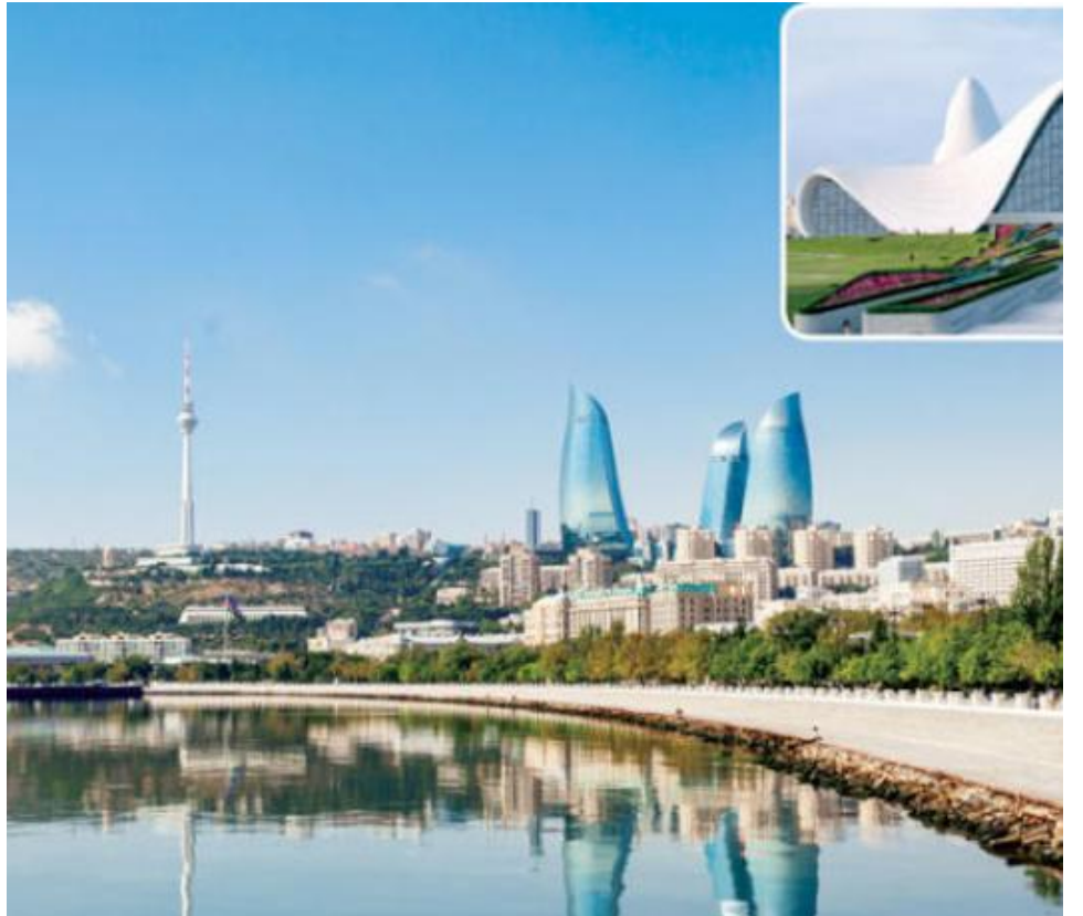
أذربيجان... حيث النفط يشفي الروح والجسد

home/article/1414366/%C2%AB%D8%B3%D9%8A%D8%AA%D9%8A-%D8%B3%D9%83%D9%8A%D8%A8-/ %D8%AF%D8%A8%D9%8A%C2%BB-%D9%8A%D9%86%D8%B7%D9%84%D9%82-%D9%88%D8%B3%D8%B7- %D8%A5%D8%B9%D9%84%D8%A7%D9%86-%D9%85%D8%B4%D8%A7%D8%B1%D9%8A%D8%B9- (%D8%B9%D9%82%D8%A7%D8%B1%D9%8A%D8%A9