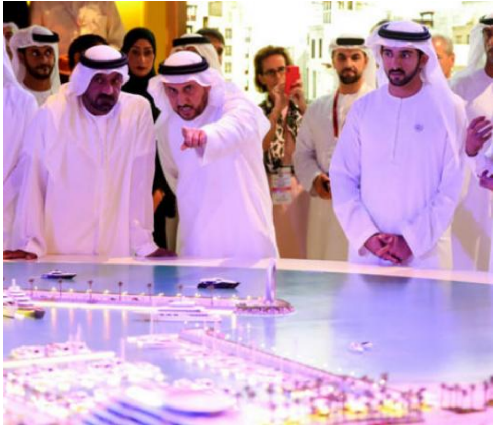
«سيتي سكيب دبي» ينطلق وسط إعلان مشاريع عقارية

home/article/1414366/%C2%AB%D8%B3%D9%8A%D8%AA%D9%8A-%D8%B3%D9%83%D9%8A%D8%A8-/ %D8%AF%D8%A8%D9%8A%C2%BB-%D9%8A%D9%86%D8%B7%D9%84%D9%82-%D9%88%D8%B3%D8%B7- %D8%A5%D8%B9%D9%84%D8%A7%D9%86-%D9%85%D8%B4%D8%A7%D8%B1%D9%8A%D8%B9- (%D8%B9%D9%82%D8%A7%D8%B1%D9%8A%D8%A9